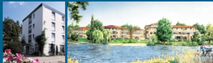
Gästehaus Bad Bevensen